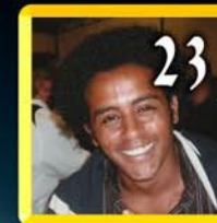
Henoc Fiorani sospia di Lenny Kravitz