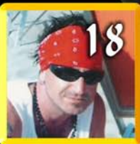
Angelo Lanzino sospia di Bono Vox