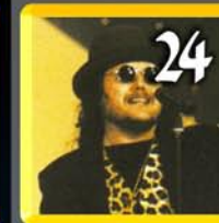
Edoardo Tiengo sospia di Zucchero