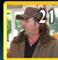
Maurizio Laghi sospia di Vasco Rossi