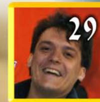
Nicola Da Conversano sospia di Massimo Ranieri