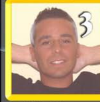
Carlino Calogero sospia di Eros Ramazzotti