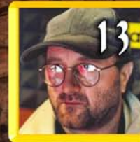
Vito D'Erì sospia di Lucio Dalla