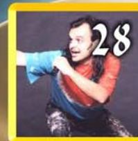
Guido Poggiani sospia di Piero Pelù