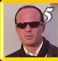
Valerio Lardo sospia di Gigi D'Alessio