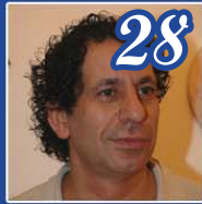
Queslati sosia di Gheddafi