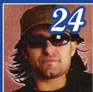
Saverio sosia di Vasco Rossi